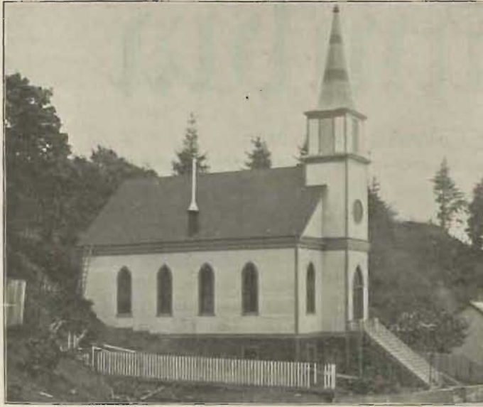
Svenska luth. kyrkan i Astoria, Oreg.

oss öfver den uppståndne Kristus och hans seger.