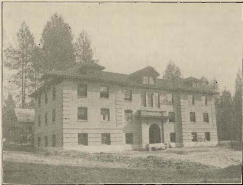
COEUR D'ALENE COLLEGE.