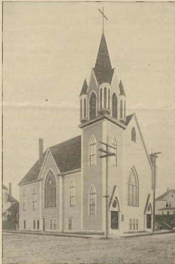
SV. EV. LUTH. KYRKAN I SEATTLE, WASH.