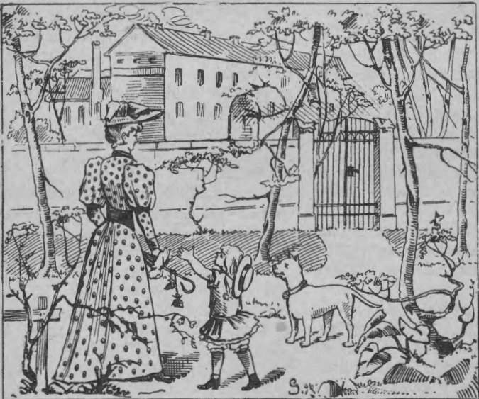
Spør er papa?