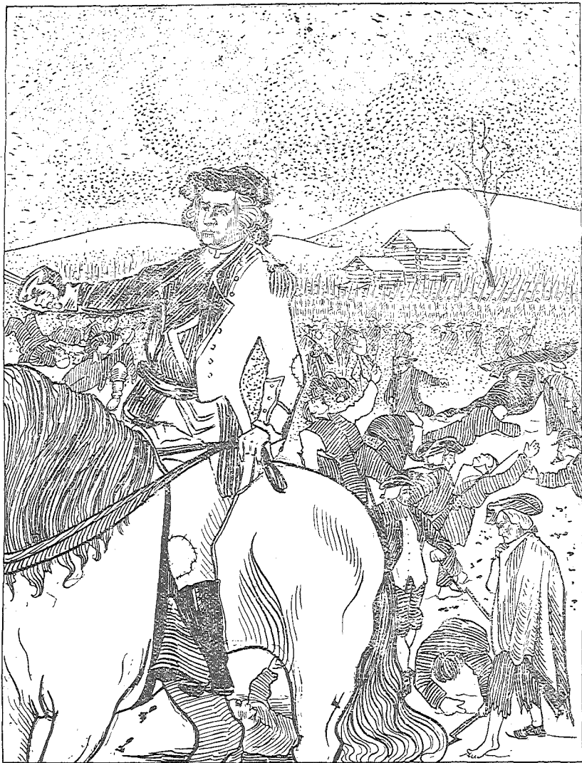
AT VALLEY FORGE.

Nedenstaaende Billede taler for sig selv. Kjendsgjerningerne giver os et ganske andet Billede af Foreholdene end det, vor lille Demagog søger at stramme Folket med.