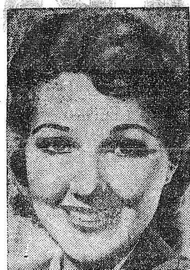
Jean Parker in "SHE MARRIED A COP" at Riviera. . . . .