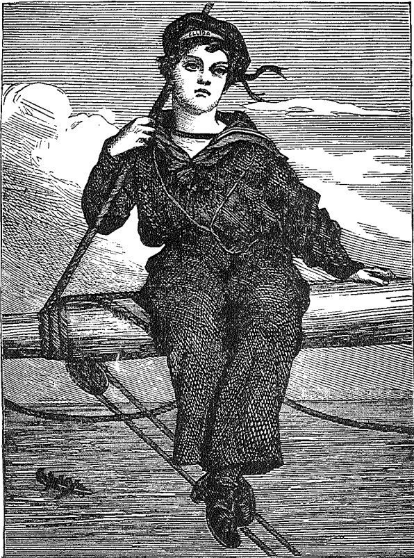
Sjögutten tænker paa Hjemmet.