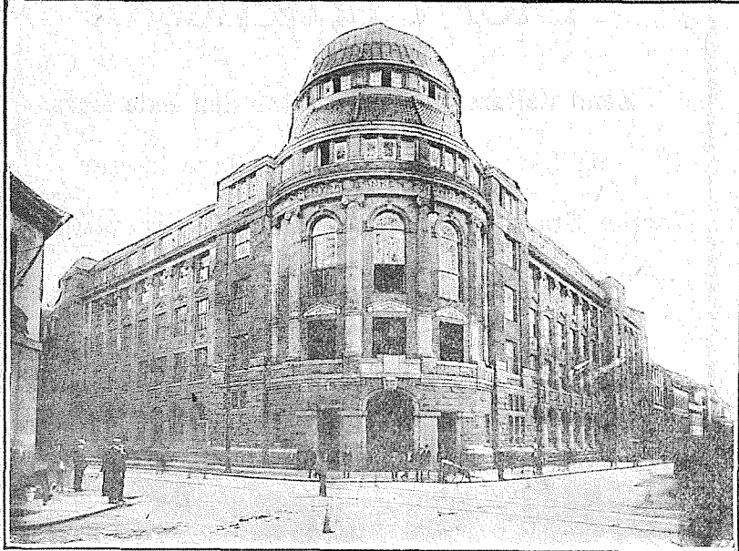
Centralbanken for Norge er en av de største pengeinstitusjoner i Skandinavi med en innskudskapital paa over 645 millioner kroner.