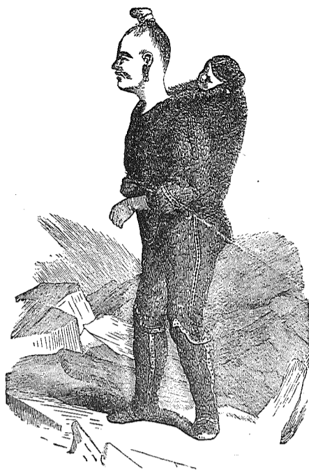
En Eskimokvinde med sit Barn.

Naar man ser paa vort Billede, vil man snart lægge Mærke til, at det ikke er nogen norsk Karakter, som raader i dette Parti, og dette vil naturligvis falde endnu mere i Øjnene, naar man ser Skoven in natura. Det er ikke dette triste, strænge Alvor, som er saa eget for vore store Granstove. Tvertimod, Alt er saa lyst og let. Vinden, der sufer saa uhyggeligt og vildt i Gran-topperne, frembringer i Bøgetræernes Løvkrone en behagelig Raslen, der maner til Liv og til Lytighed. Man føler sig saa oprømt og saa glad, medens de tunge, mørke Granstove har den modsatte Virkning. Det er derfor intet Under, at Gammen og Glæde trives saagodt i Bøgeskoven ved Laurvig, at man ofte ikke stilles før langt ud paa Natten. I den nordvestlige Ende af Skoven finder vi den dejligste Udsigt over Farrisvandet og dets mange smaa Øer. Hid gaar i Almindelighed de Fornemmers Spadserure, thi Bøgeskoven er ogsaa Laurvigens mest yndede Spad-