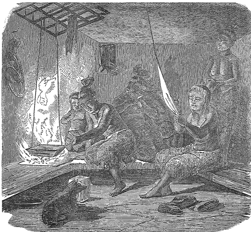
Det Indre af en Eskimohytte.