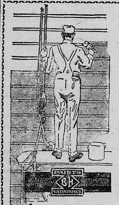
728 St. Helens Avenue "We Hurry"

Omtrent 400 av de indfødte er stemmeberettigede og tar del i valg paa territorialstyret.