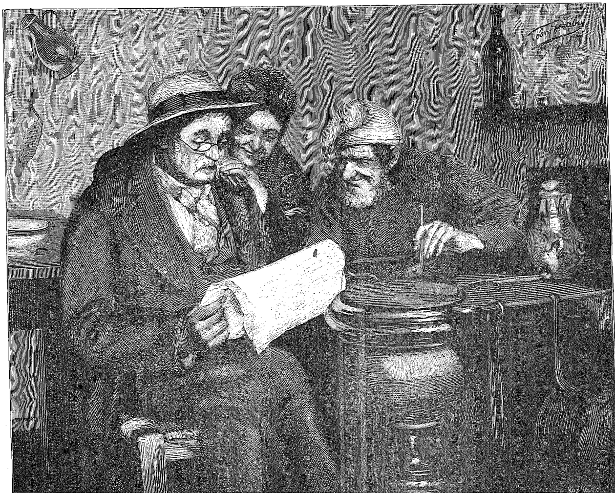
En interessant Artikel. Efter et Maleri af L. Harbo.