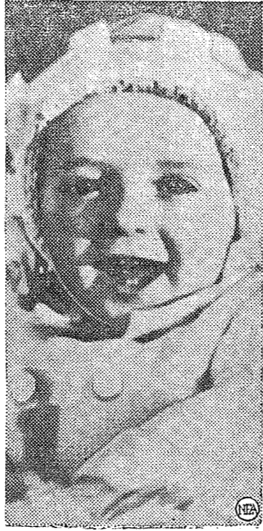
Prins Harald er bare ni måne-der gammel, men engang vil han kanskje arve Norges kongekrone.