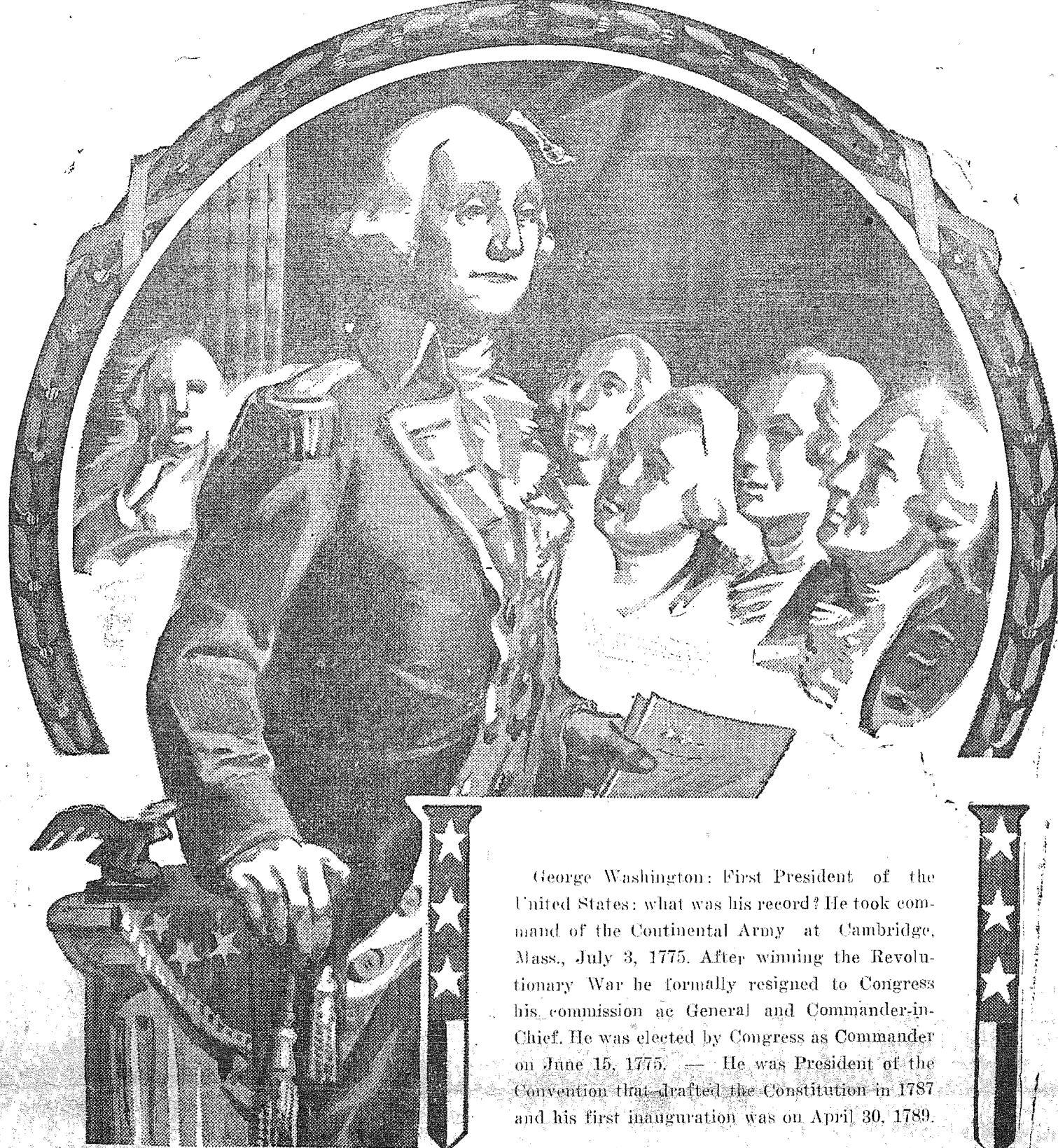
George Washington: First President of the United States: what was his record? He took command of the Continental Army at Cambridge, Mass., July 3, 1775. After winning the Revolutionary War he formally resigned to Congress his commission as General and Commander-in-Chief. He was elected by Congress as Commander on June 15, 1775. — He was President of the Convention that drafted the Constitution in 1787 and his first inauguration was on April 30, 1789.

Mannen, som i Spania hadde kjøpt på opprørernes side, hadde fått smuglet med sig granaten hjem. Han vil nu få en større bot for å ha smuglet inn våben.