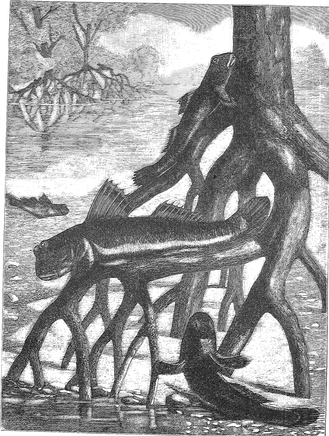
Fiske paa Land.