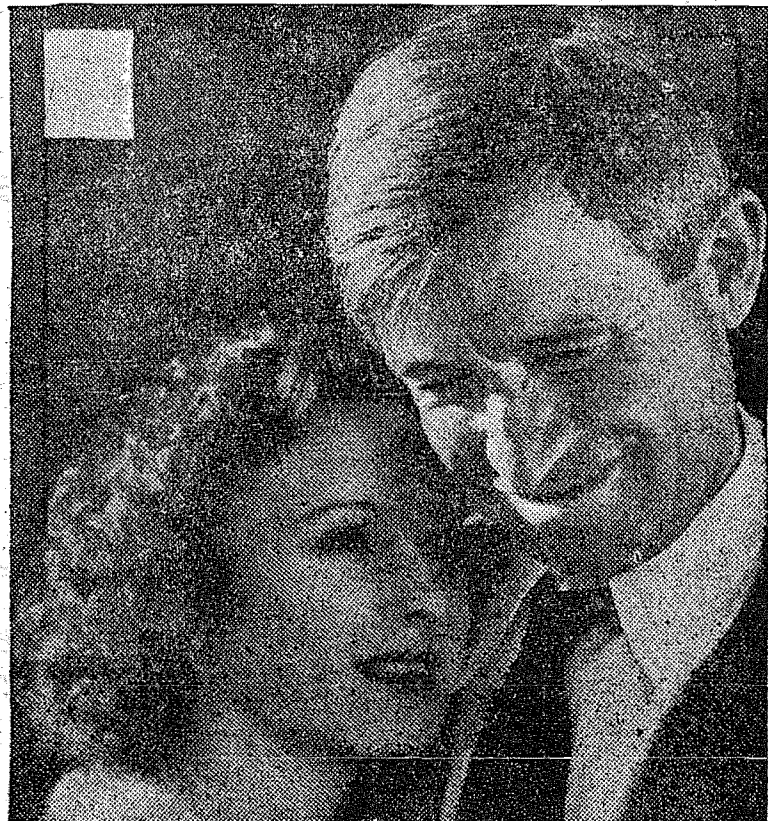
Vivacious Dorothy Jordan and hilarious Will Rogers have a lot to do towards making "Down To Earth," the new Fox production, one of the funniest comedies of the season.

Smør, Egg og Delikatesser Første dør fra 11te St.