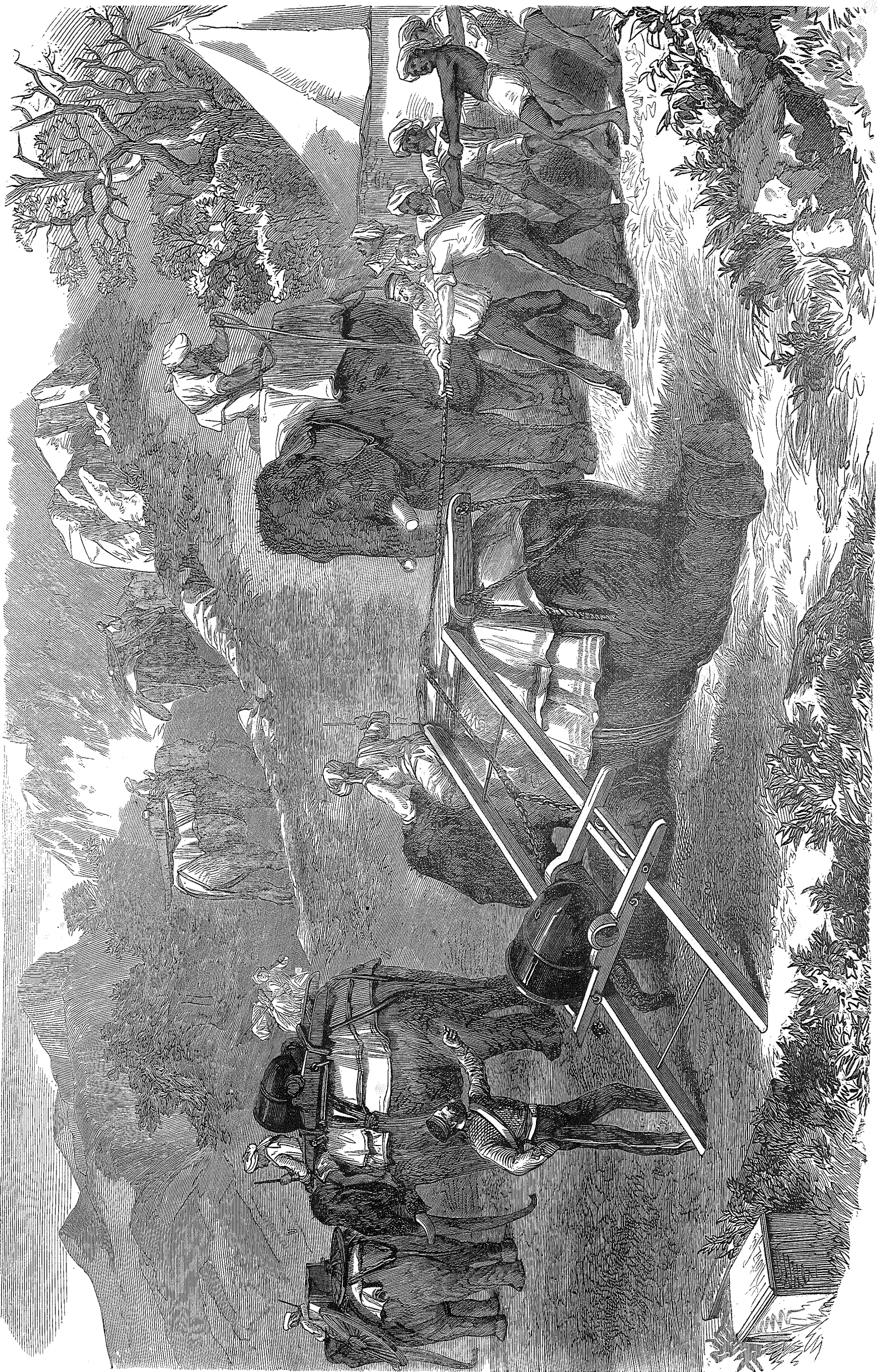
Et Billede fra Engelskmandenes Tog i Abyssinien.