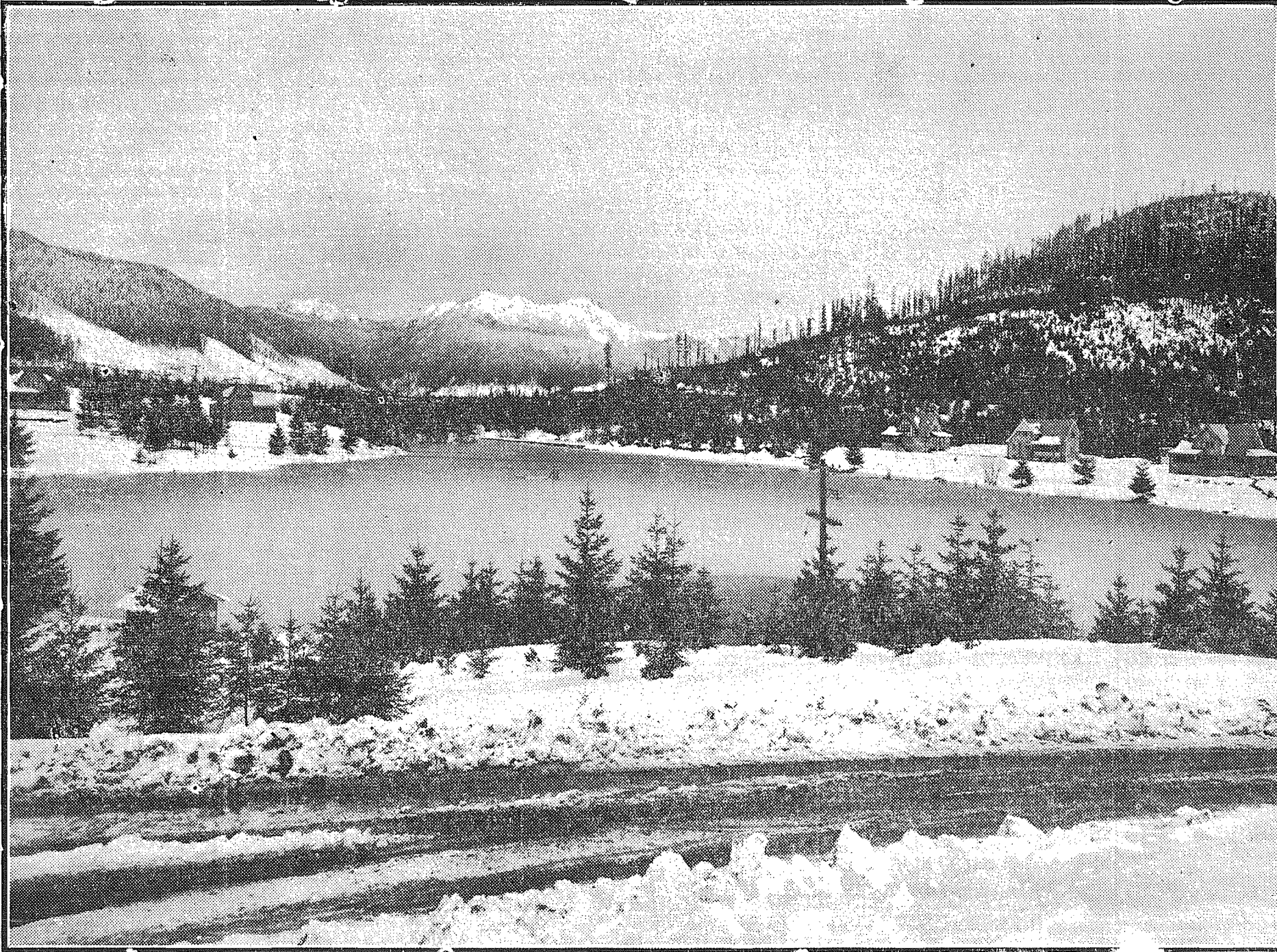
Looking across the employe's recreation pond to some of the 16 beautiful modern, all-electric homes provided for employes at the City of Tacoma's Cushman Electric Generation Plant No. 1. In the background rise the snow-capped peaks of Mt. Elinor, Mt. Rose and Mt. Washington, whose drainage areas help to keep Lake Cushman, the power reservoir, supplied with water for the turbines.