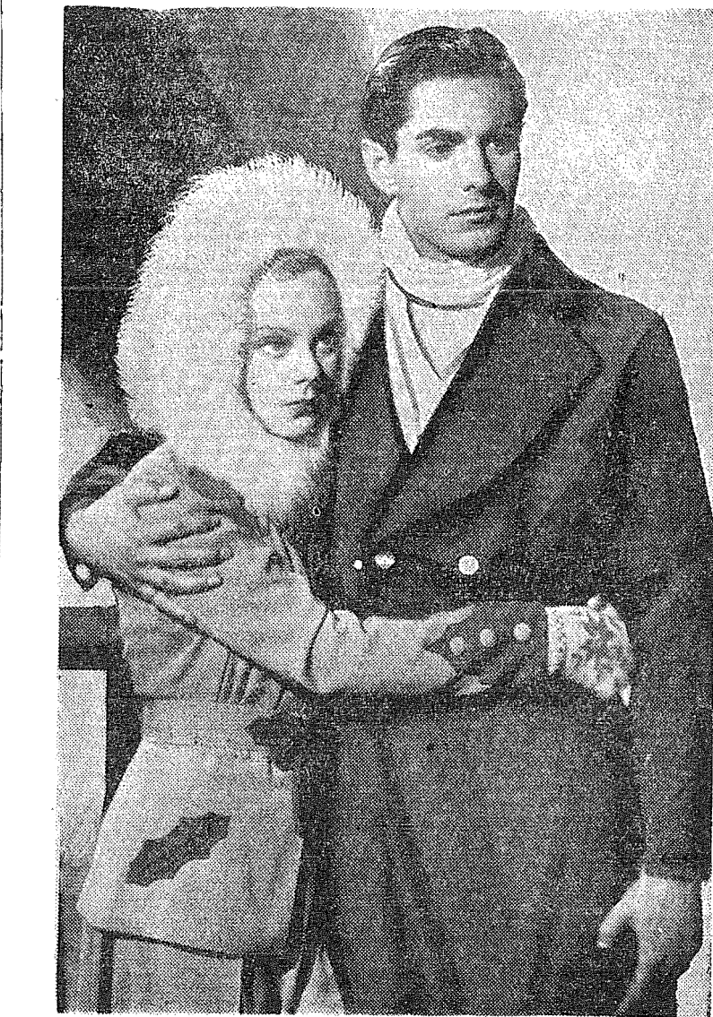
SONJA HENIE and TYRONE POWER som spiller i filmen "Thin Ice" Filmene kommer til Music Box den 29de sept.

Heltegardene er to orholdsvis små gårdsbruk som ligger oppe i en høi bakkeskråning ovenfor veien gjennom Viksdalen. Husene, som ligger tett op til hverandre, er små og primitive; fronten viser nedover mot veien. Man kan godt si at de to naboer har felles tun, således at beboerne fra dag til dag har rik anledning til å se hverandres bevegelser, ja, endog lukte hvad slags suppe der blir kokt i de små kjøkkener, opstår der hat mellom naboer som lever så tett inn på hverandre forekommer der alltid et eller annet som gir hatet næring. Således vil det alltid være. Hver liten hendelse er som å kaste et stykke tre i varmen; bålet øker stadig. Og hele familien deltar hver på sin side. Apenlyst forulemper man kanskje ikke hverandre, men hvert eneste blik vir-