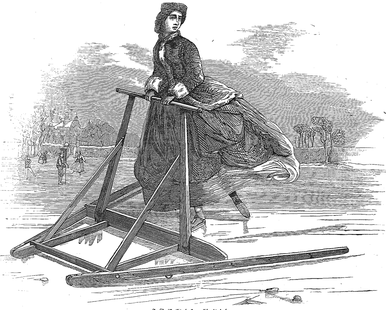
A-B-C-Stol for Skøtølere.

Thor sad over Bøtten med den ene Arm om Tross- sen og den anden om Maris Liv; hun stod ligesom paa Knæ paa Bøt-