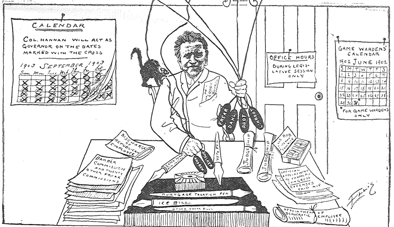
La Follette har sin egen Maade at føre Regjeringen paa.