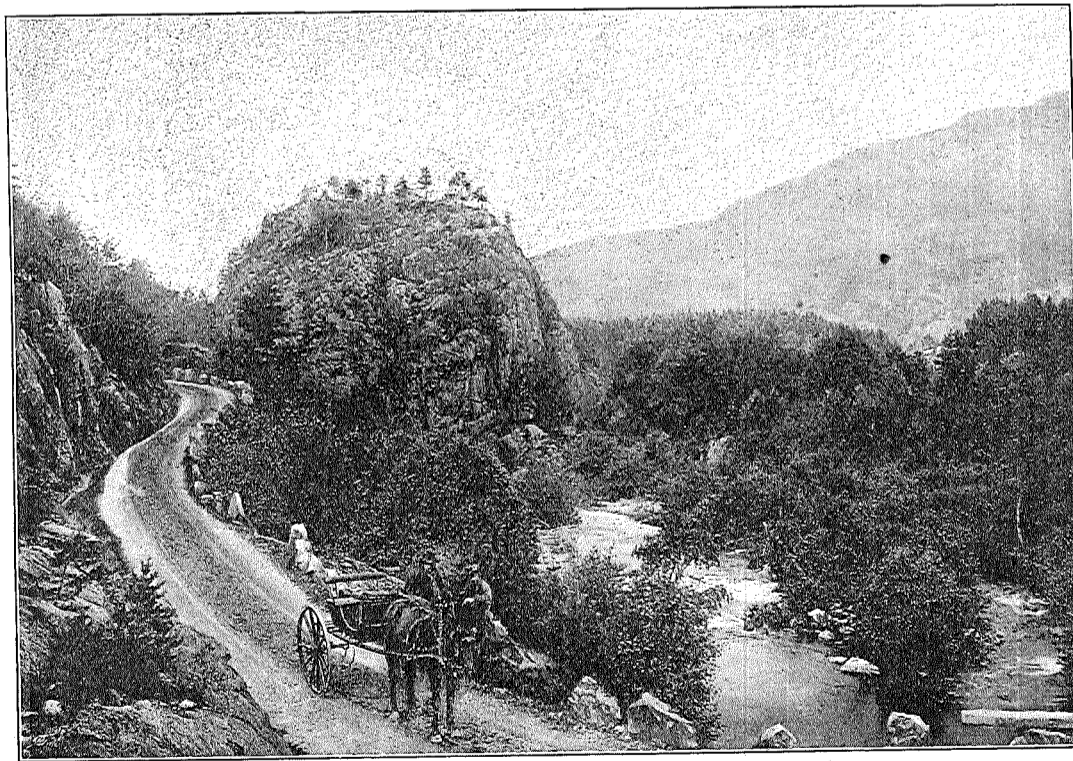
Parti fra Suldal. II.