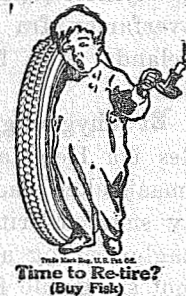
Time to Retire? (Buy Fish)