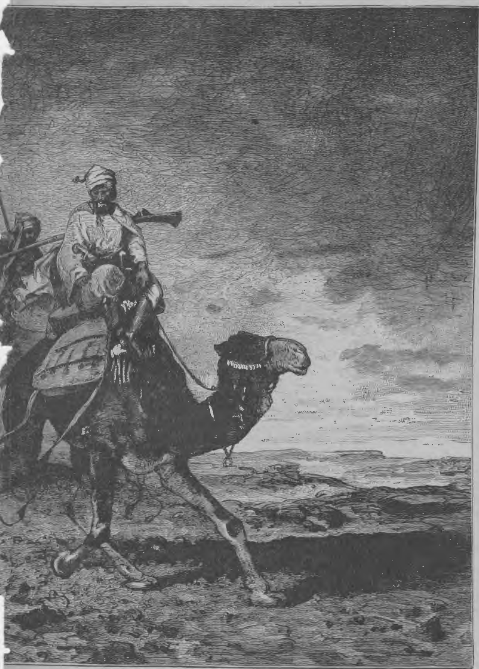
ore i ørknen.