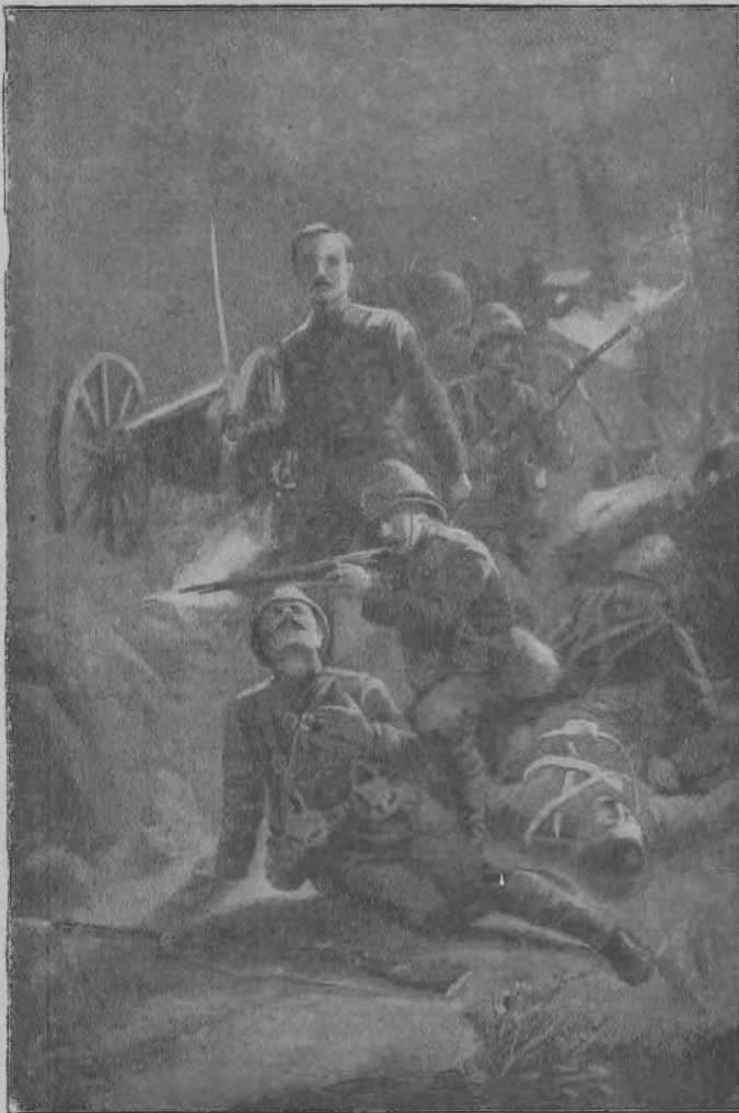
Midt i lugleregnet. Scene fra krigen mellem englismænd og bær.