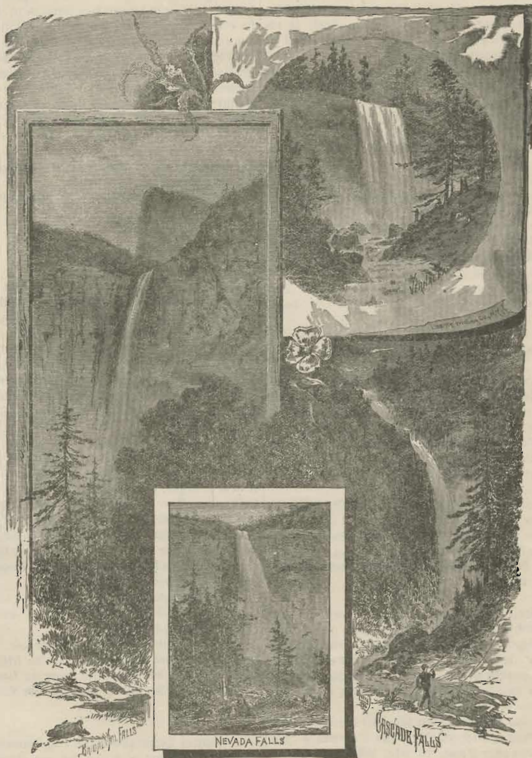
Partier fra Yosemite Dalen.

terne, blive daarlige og daarlige i at udtrykke sig paa Engelsk. Nutidens Gutter ere befynderlig tanketomme og idefattige, og de faa Ideer, de have, udmærke sig ved sin