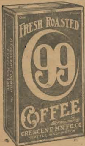
Kun 25c pr pund.

Alle Norske forstaar sig paa Kaffe, derfor foretrækker de '99 Kaffe — 25c Pundet.