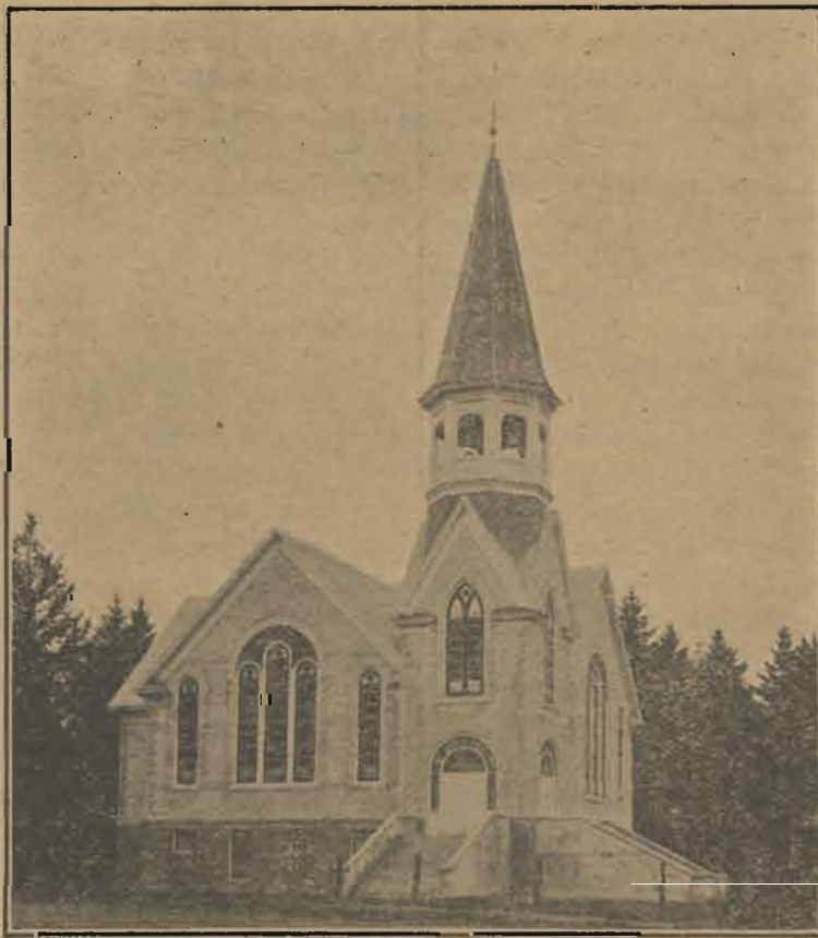
Parkland Menigheds Kirke

havde fuldført dette Størværk at bygge denne vakre Kirkebygning; Herren havde hjulpet hidindtil. Saa fremholdt han paa den for ham særegne indtrængende Maade hvorledes den vakre Kirke kunde blive dem til varig Velsignelse. Dette sker: