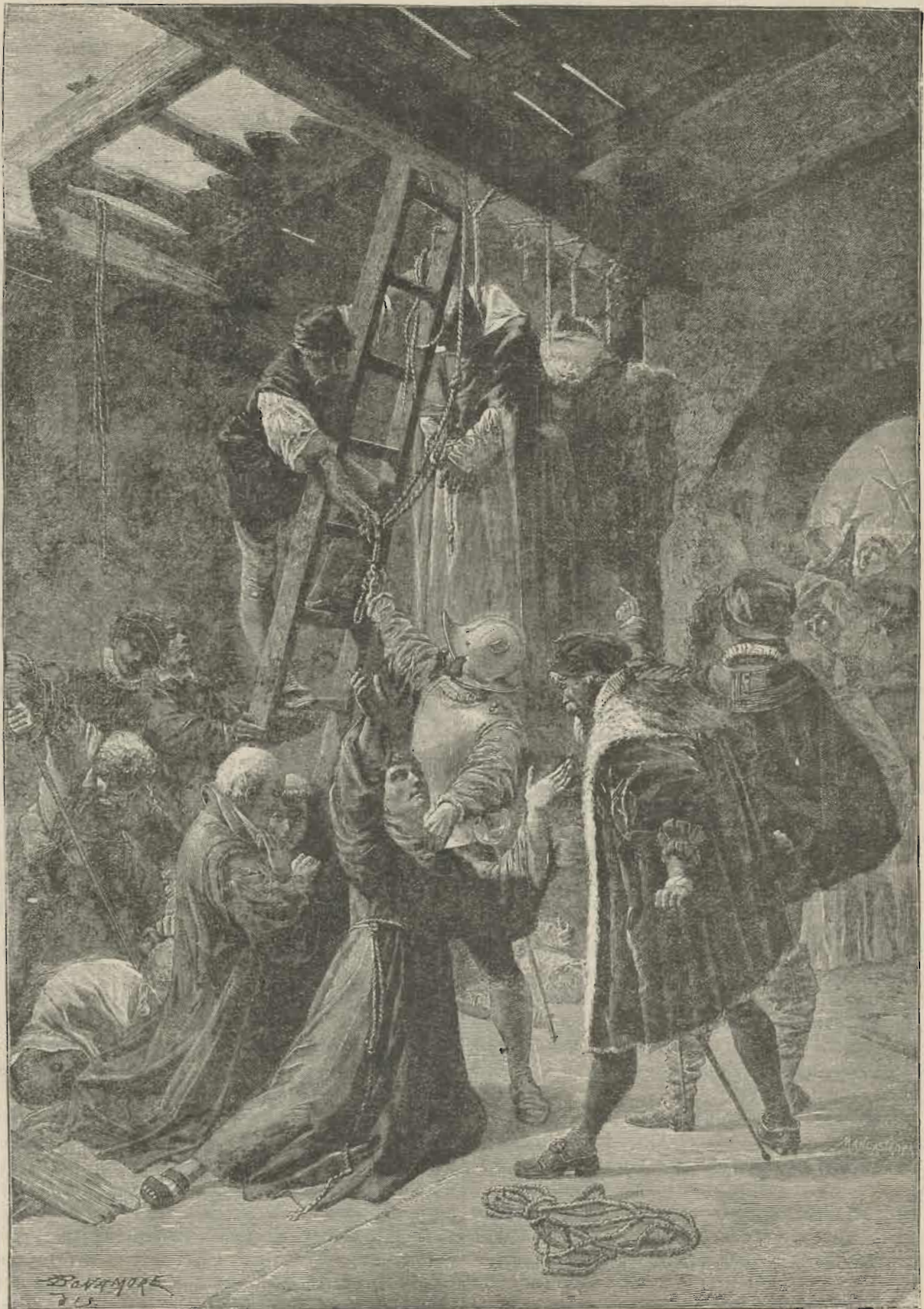
En Scene af den „hellige“ Inquisition.