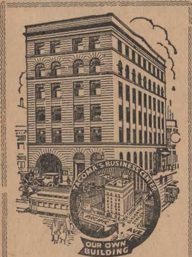
Vor egen Bank Bygning